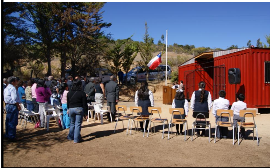
ESCUELA JOSE M. CARRERA 2011